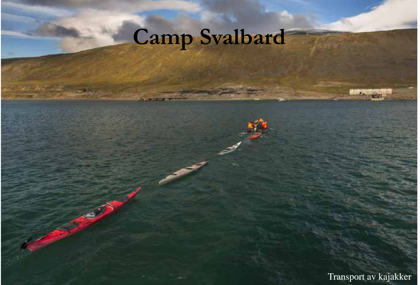
Transport av kajaker

Da Camp Svalbard spurte meg om jeg kunne stille som padleinstruktor for 48 elleville Svalbard-ungdommer, var det ikke så vanskelig å si ja.