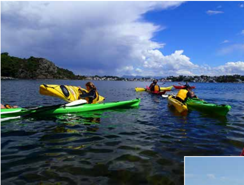
Her trenes det på kameratredning