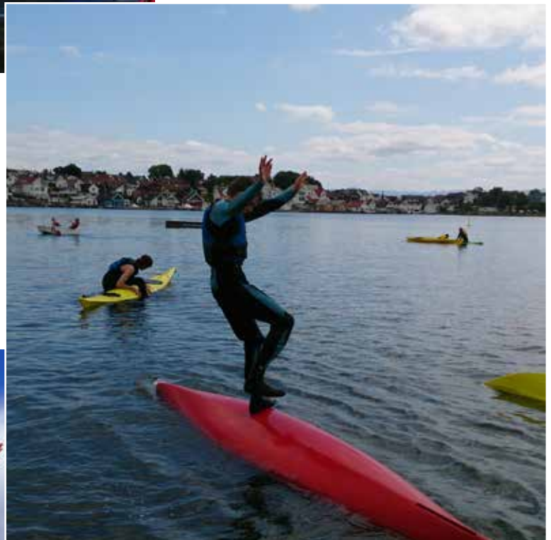
Balansen er på topp