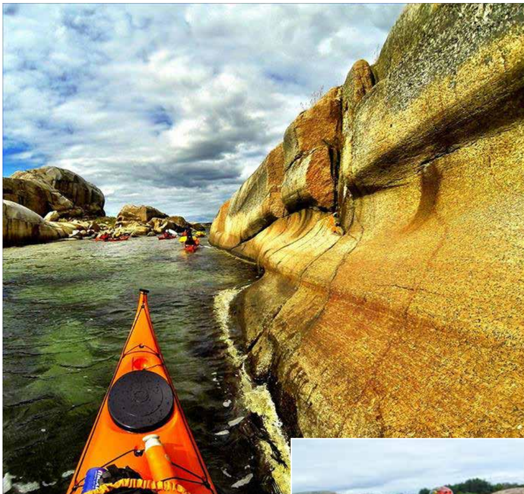
Aktivitetslederkurs ved Verdens Ende