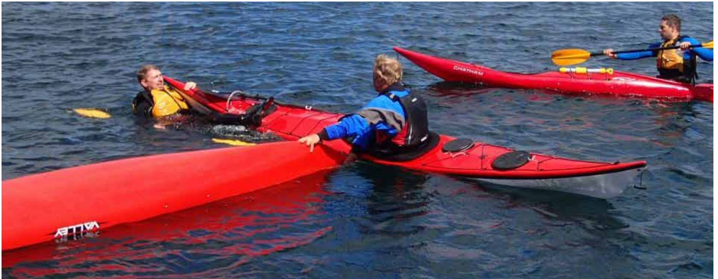
Her trenes det på kameratredning på grunnkurs.

PS – kan gjerne kombineres med klubbturn til Klosterøy/Fjøløy samme helg ;-)